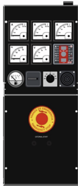
Панель ручного управления ДГУ

* В случае автоматизации с применением контроллера СЕС7, ДГУ с панелью М6 должна быть оборудована подзарядным устройством АКБ (опция).