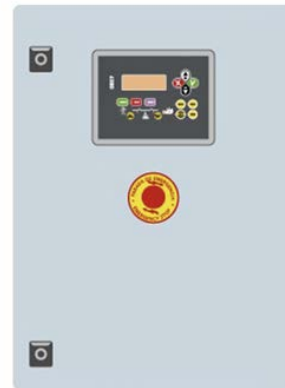
Внешний шкаф автоматического ввода резерва КОНТРОЛЛЕР СЕС7