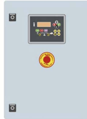
Внешний шкаф автоматического ввода резерва КОНТРОЛЛЕР СЕС7