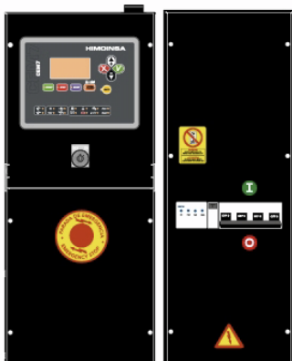
Панель управления ДГУ с автоматическим вводом резерва КОНТРОЛЛЕР СЕА7