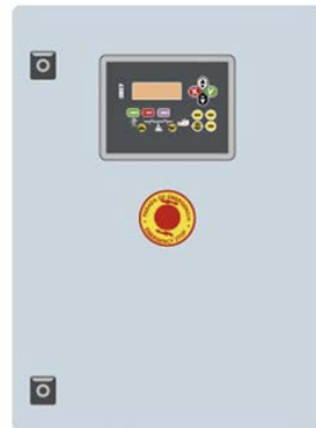
Внешний шкаф автоматического ввода резерва КОНТРОЛЛЕР СЕС7